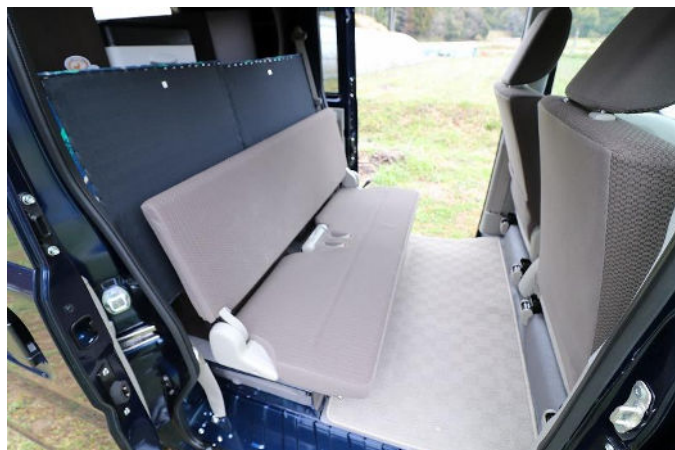
座席を開くと2名座れます。