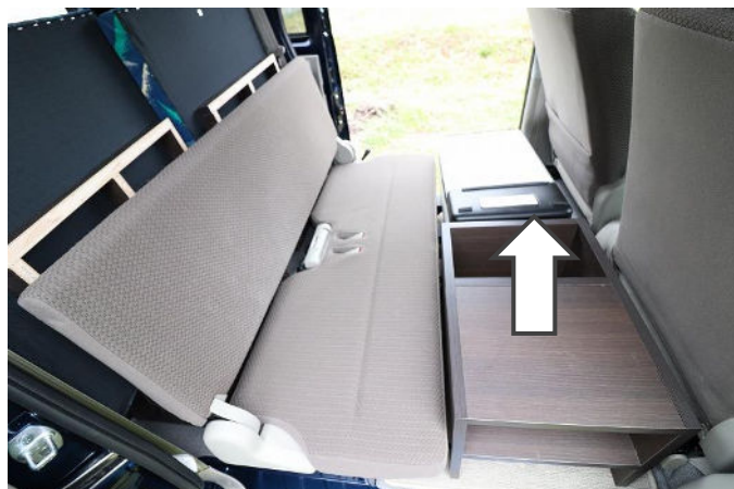
シューズボックスを取り外します。