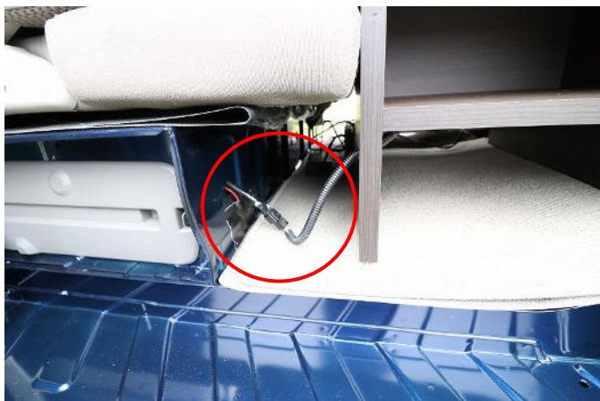
シューズボックスの照明コードを外します。