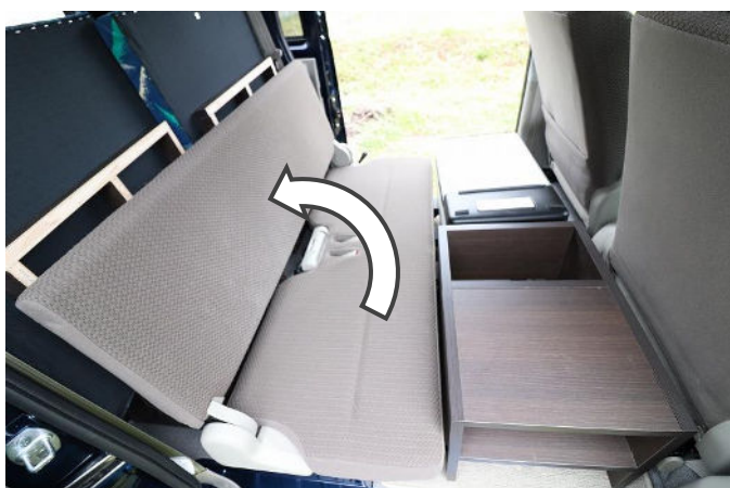
背もたれを起こします。