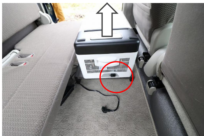
冷蔵庫のコンセントを外して、冷蔵庫を取り外します