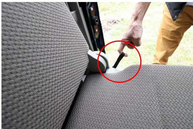
ひもを引いてロックを解除